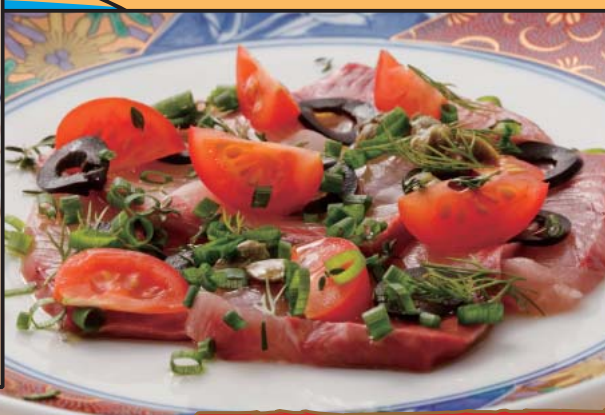
寒鰯のカルパッチョ 499