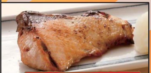
寒鰯 塩焼き 698