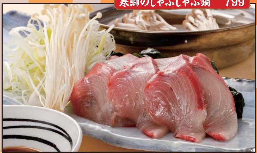
寒鰯のしゃぶしゃぶ鍋 799