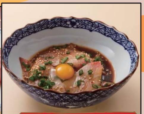
漁師風寒鰯の漬け 499