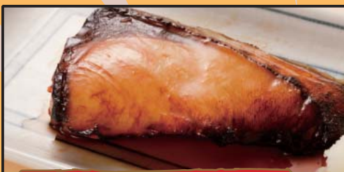
寒鰯 照り焼き 698